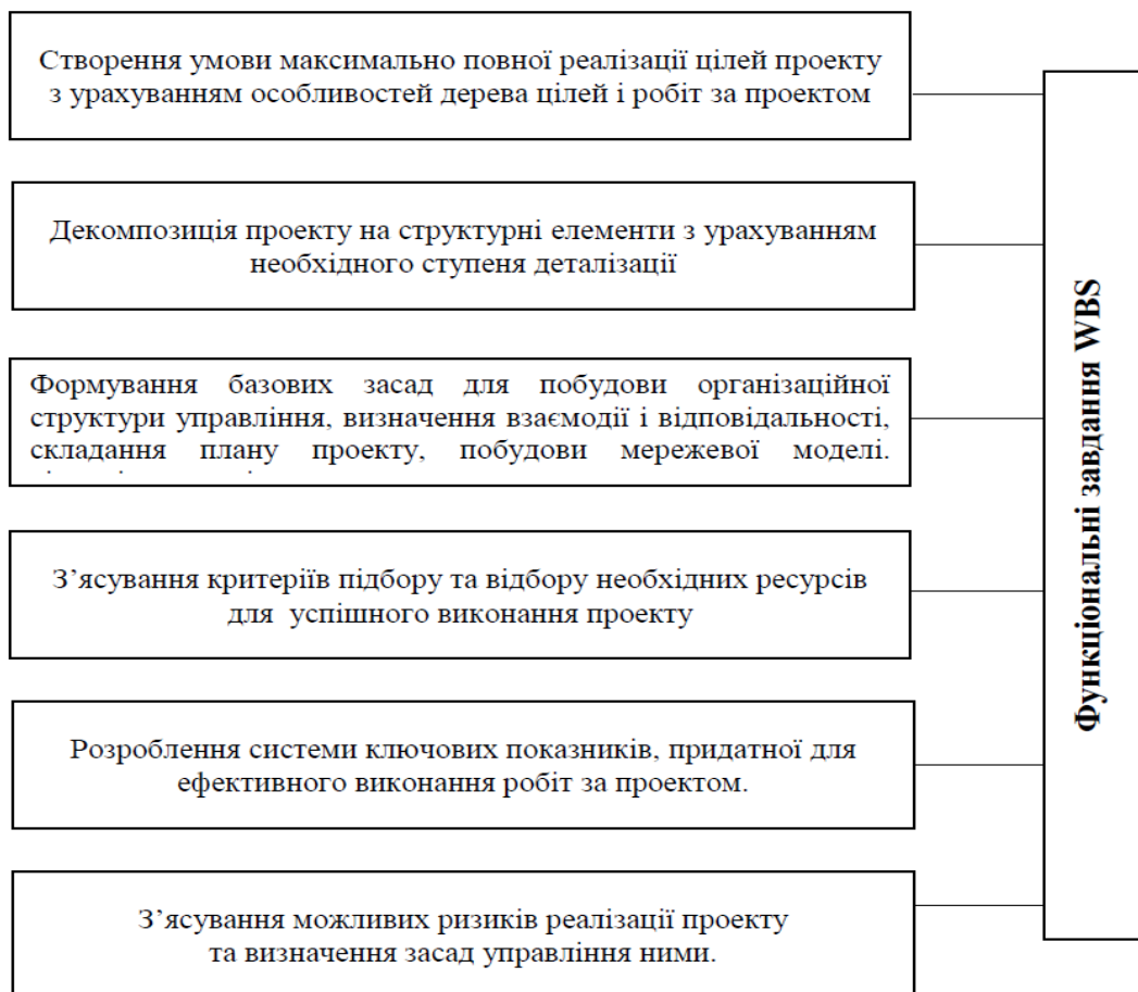
Рис. 2.1. Функціональні завдання WBS

Акцентуємо увагу, що головним недоліком використання односпрямованого напрямку структуризації проекту (побудови WBS) вважається неможливість урахування координації робіт, відповідальності за їх виконання і визначення їх вартості). За таких умов вважаємо необхідним розглянути двоспрямовану модель структуризації проекту OBS (організаційну структуру проекту).