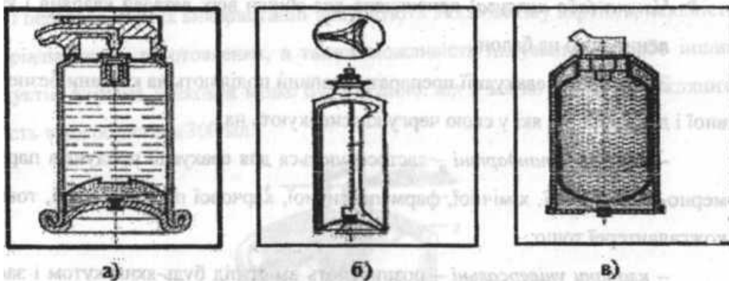
Рис. 2. Двокамерні аерозольні упаковки: